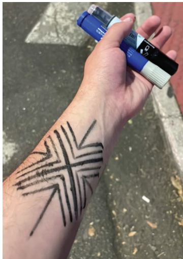
Figura 4 – Pintura corporal feita a partir da tinta do jenipapo