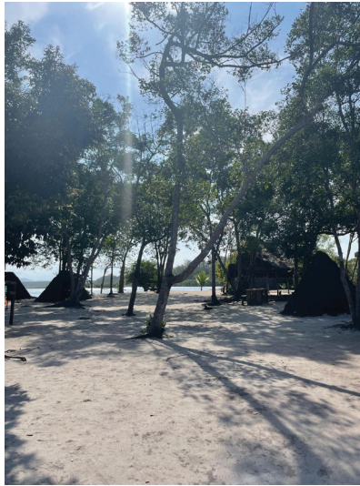
Figura 3 – Representação de construções indígenas