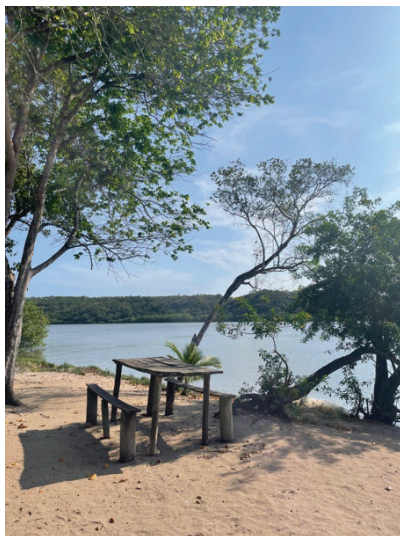
Figura 2 – Retrato da paisagem local