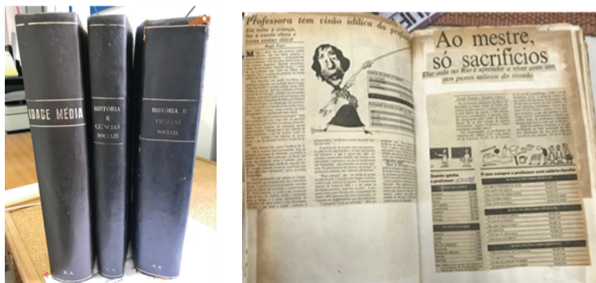
Figura 2 – Dossiês encadernados e Dossiê aberto

Esse comportamento por assim dizer ritualístico, tornou-se o hábito de toda uma vida e resultou na composição de mais de 70 volumes encadernados com capa rígida, com cerca de 300 páginas cada, distribuídos numa prateleira que se espalhava acima e em toda a extensão do corredor de seu apartamento. A maior parte desses volumes tratava da história contemporânea, de locais e culturas sobre as quais não havia, ainda, estudos consistentes e acessíveis.