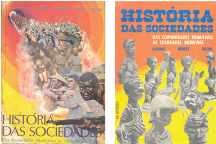
Figura 4 – Capas dos livros citados